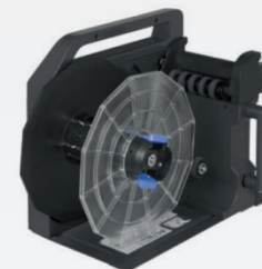
TU-RC7508 (Accesorio opcional - no viene incluido)