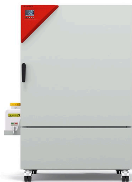
Modelo KBF-S ECO 240