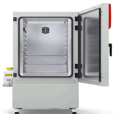
Modelo KBF-S ECO 240