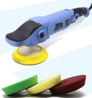
3 PADS DE REGALO