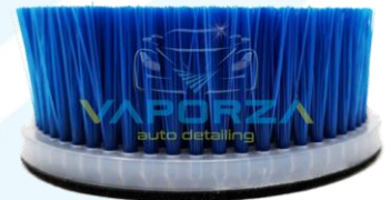
Cepillo 5" para pulidora