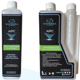
APC Detergente Multi propósito

Estos Accesorios se vende por separado, más información en www.vaporza.com