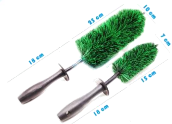
Cepillos para rines

Gladiola No. 65 Col. Agricola, Zapopan, Jalisco Mexico Tel. (33) 36843628, 31889968, 01800-00-VAPOR (82767)